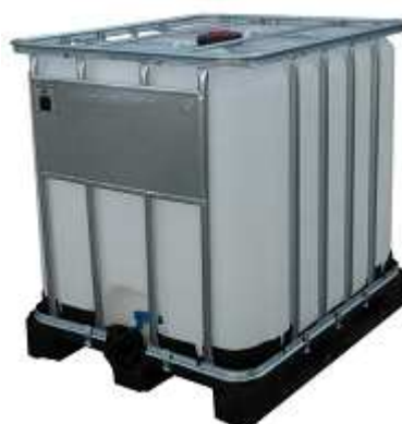
DEPÓSITO PLÁSTICO Capacidad: 600 y 1.000 L.