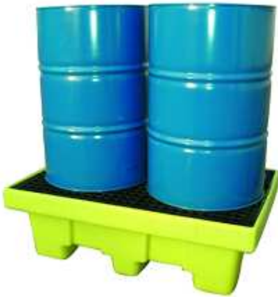
CUBETA BIDONES Bidones: 1, 2, 4 y 8