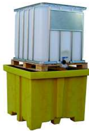
CUBETA DEPÓSITOS Depósito: 1 y 2