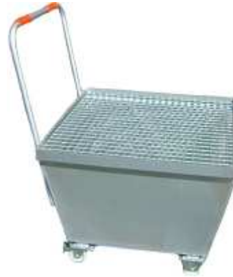
CUBETA CON RUEDAS Capacidad: 220 L. Bidones: 1 y 2 Con rejilla galvanizada