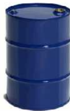
BIDÓN CHAPA Capacidad: 55 y 218 L.