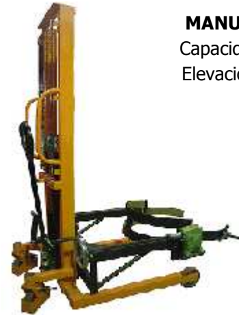
MANUAL PARA PALETS Capacidad: 400 Kg. Elevación: 1.350 Mm.