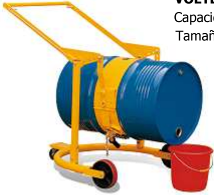
VOLTEADOR DE BIDONES Capacidad: 364 Kg. Tamaño bidón: 210 L.