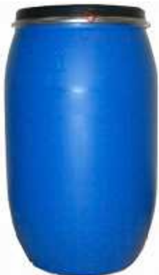
BIDÓN PLÁSTICO Capacidad: 60 y 220 L.