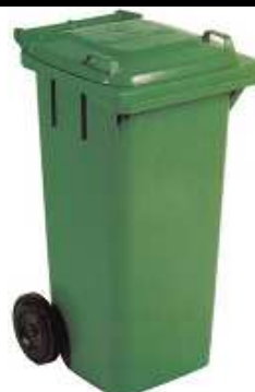
CONTENEDOR DE BASURA Capacidad: 50 a 1.000 L. Diferentes medidas