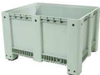
CONTENEDOR DE PLÁSTICO Capacidad: 525 Y 610 L. Diferentes medidas. Opción: con ruedas