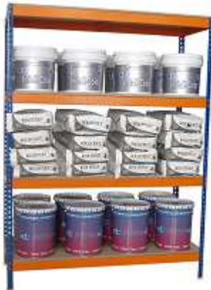
ESTANTERÍA Baldas: 3 - 4 Diferentes medidas.