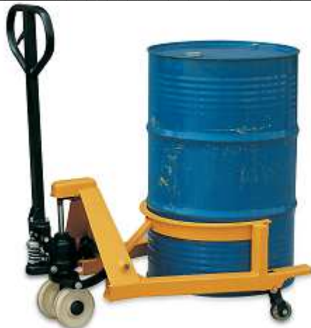
VOLTEADOR DE BIDONES Capacidad: 364 Kg. Tamaño bidón: 210 L.