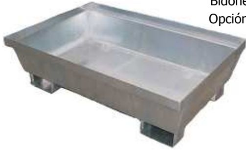
CUBETA GALVANIZADA Capacidad: 125 1.000 L. Bidones: 2 y 4 Opción: rejilla galvanizada