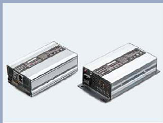
El cargador tiene un cuerpo compacto y es fácil de transportar.