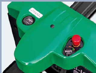
El cuerpo tiene líneas suaves, una enorme sensación de movimiento y un perfil compacto, en consonancia con la actual tendencia de diseño del aspecto.