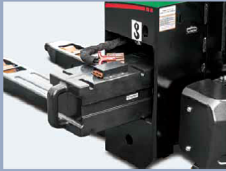
Batería fácilmente reemplazable