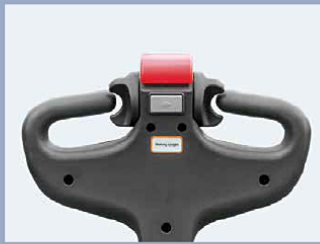
La función de gestión del timón vertical permite trabajar dentro de un espacio muy reducido, como puede ser un contenedor.