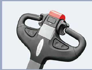
El timón modular es simple pero confiable y bonito, todas las piezas que contiene se pueden reemplazar por separado y todas las operaciones se pueden hacer fácilmente con una sola mano.